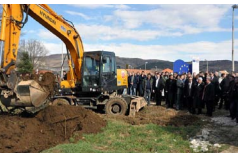
→ Početak radova u Drnišu

Više na stranicama Vlade RH i Ministarstva mora, prometa i infrastrukture .