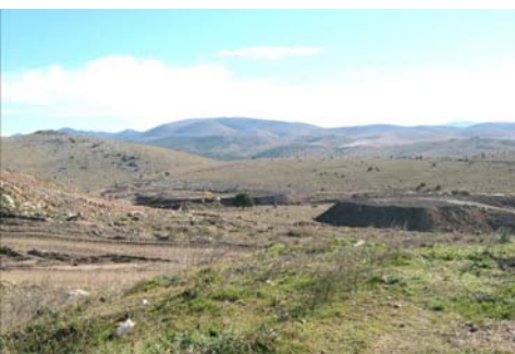
→ Teren budućeg odlagališta otpada u Bikarcu