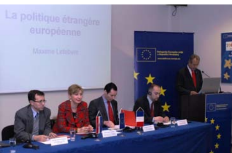
→ Sudionici predavanja u Informativnom centru EU-a