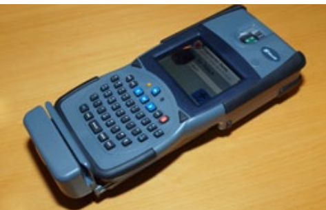
→ Mobilni čitač putovnica

Više na stranicama Delegacije i MINGORP-a .