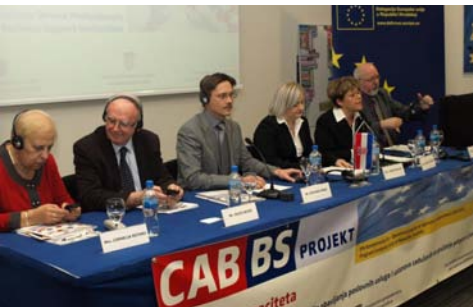
→ Predstavljanje projekta u Informacijskom centru EU-a

Više o samim projektima stranicama Delegacije a o Europskom instrumentu za demokraciju i ljudska prava (EIDHR) na stranicama Europske komisije.