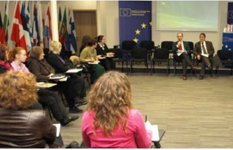
→ Sudionici okruglog stola u Informacijskom centru EU-a