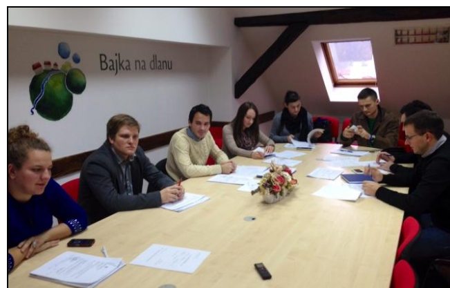
Sedma sjednica Županijskog savjeta mladih

Usvajanjem programa rada za 2014. godinu Savjet mladih nastavio je sa kontinuiranom raspravom o specifičnim problematikama mladih. Za 2014. godinu predviđeno je 7 tematskih sjednica s najvećim naglaskom na socijalnu i ekonomsku uključenost mladih u društvo. Sedma sjednica Savjeta mladih najvećim je dijelom posvećena identifikaciji aktualnijih problematika s kojima se mladi susreću. Tijekom 2014. godine Županijski savjet mladih odlučio je zadržati već implementiran koncept rada temeljen na tematskim sjednicama. Pokazalo se kako otvorenom raspravom sa stručnim i iskusnim osobama, Županijski savjet mladih može uočiti uzroke određenih problema. Tradicionalni pristupi rješenjima ostavljaju se u drugom planu jer dugoročne probleme ne možemo riješiti primjenom onih razmišljanja koja su nas dovela do tih problema. Županijski je savjet