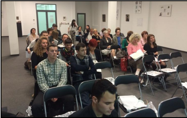
Konferencija o potencijalima razvoja Društvenog poduzetništva