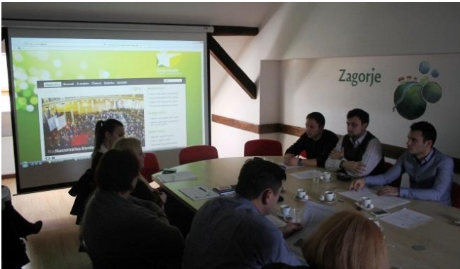
Petnaesta sjednica Županijskog savjeta mladih