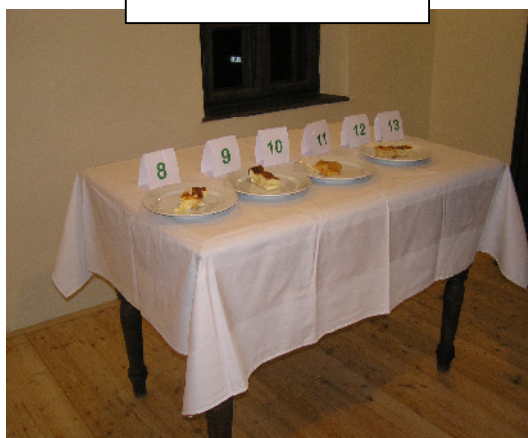
SLIKA 2. Štruklijada

Manifestacija „Štruklijada“ održana je u organizaciji Krapinsko – zagorske županije, Zagorske razvojne agencije te obiteljskog poljoprivrednog gospodarstva „Kos“, a pod generalnim pokroviteljstvom Ministarstva poljoprivrede, ribarstva i ruralnog razvoja te medijskim pokroviteljstvom Radija Kaj.