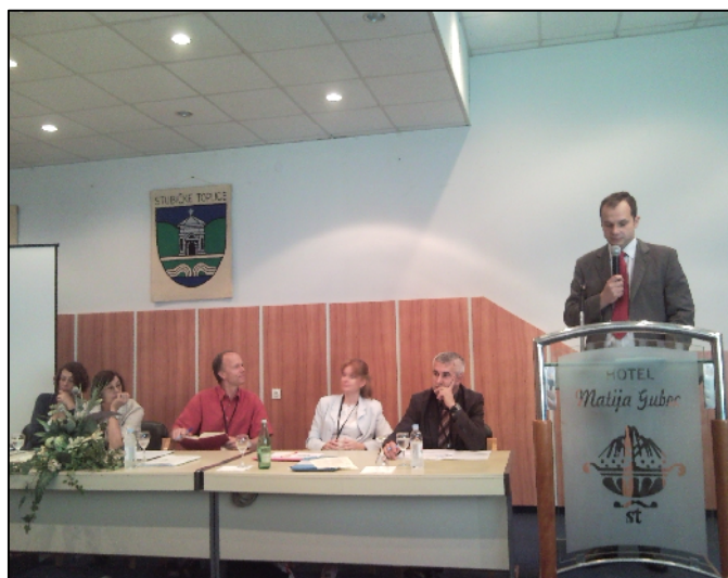
SLIKA 6. Kongres ruralnog turizma

Od 30.06.2009. do 4.07.2009. održan je kongres ruralnog turizma na temu: „Oporavak ruralnog gospodarstva i EU proširenje u Jugoisto nu Europu“. Organizatori doga anja bili su Hrvatska mreža za ruralni razvoj, Slovenska mreža za ruralni razvoj i PREPARE. Kongres se održavao u Sloveniji i u Hrvatskoj u Donjoj Stubici. Kongresu je prisustvovalo 88 sudionika iz sedamnaest zemalja. Zagorska razvojna agencija bila je jedan od sudionika kongresa, a organizirala je turisti ko upoznavanje Donje Stubice i okolice za sve sudionike kongresa.