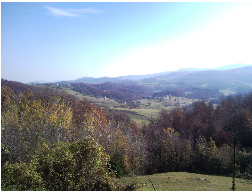
Slika 7. Posjet LAG-u Od Pohorja do Bohorja