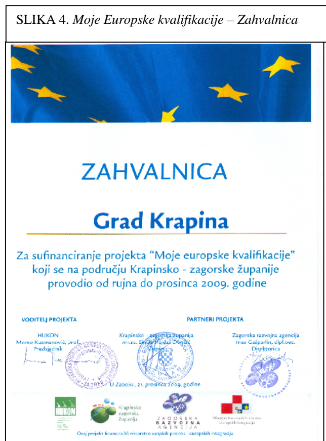
SLIKA 4. Moje Europske kvalifikacije – Zahvalnica

Završna svečanost projekta na kojoj su sudjelovali svi učenici iz srednjih škola uključeni u projekt održana je 21. prosinca 2009. godine u Gimnaziji Antuna Gustava Matoša u Zaboku. Svim učenicima i profesorima sudionicima dodijeljene su potvrde o sudjelovanju, a srednjim školama i gradovima partnerima zahvalnice za podupiranje projekta. Potvrde i zahvalnice dodijelio je župan Krapinsko-zagorske županije, g. Siniša Hajdaš Dončić, a svečanosti su prisustvovali predstavnici srednjih škola sudionica u projektu te gradonačelnici grada Zaboka i Oroslavja.