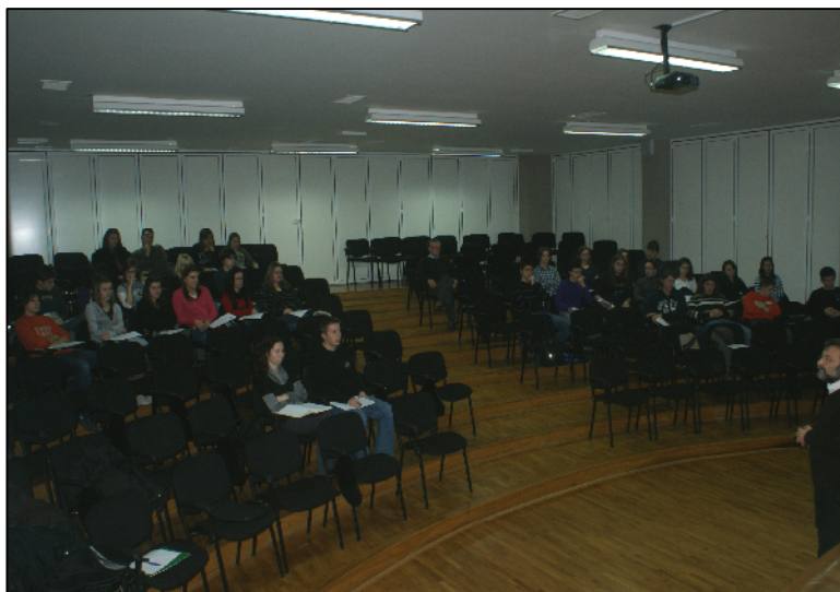
SLIKA 3. Moje Europske kvalifikacije u Srednjoj školi Krapina

Opći cilj projekta bio je proširiti znanja u svezi s integracijom Republike Hrvatske u Europsku uniju kod učenika završnih razreda srednjih škola Krapinsko – zagorske županije provedbom programa izobrazbe – u obliku jednodnevnih programa interaktivnih radionica koje su bile usmjerene na razvijanje sposobnosti samostalnog učenika o EU i proaktivnog pristupa u sagledavanju vlastite pozicije, šansa i prepreka koje se mladim ljudima otvaraju uključivanjem njihove domovine u širi institucionalni, politički, gospodarski i kulturni okvir.