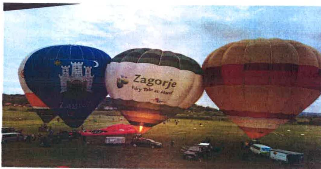
Međunarodni festival balona

AKTIVNOSTI: U tri dana Relly-a balonaši iz čitavog svijeta okušali su svoje vještine letenja iznad Zagorskih brega. Uzbudljivi prizori masovnih uzlijetanja, noćne iluminacije i umjetničke performance. Uz volontere balon kluba posjetitelji će moći prošetati kupolom balona, okušati se u balonaškom natjecanju i podići se balonom na krati vezani let .