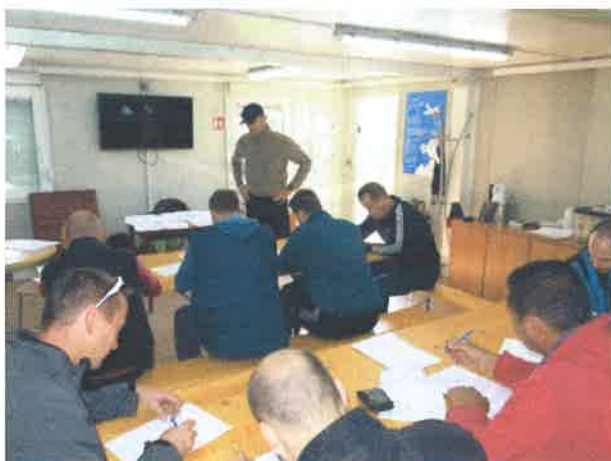
SEMINAR: Pilot parajedrilice s pomoćnim motorom

Seminarom su postignuti uvjeti za dodjelu povlastice sportašima, instruktorima i operaterima za provedbu parajedriličarskih programa na najvišoj razini budući su nositelji istog bile kvalificirane organizacije i ovlaštene stručnjaci.