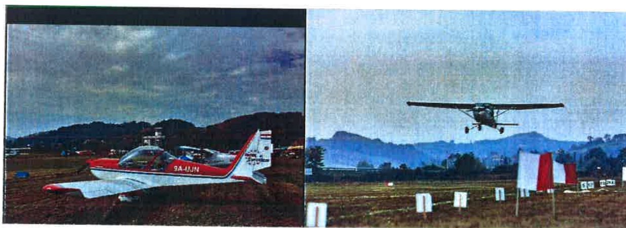
II Kup Grada Zaboka – natjecanje u preciznom slijetanju

CIJL natjecanja bilo je postizanje bolje suradnje sa aeroklubovima iz susjednih zemalja, prepoznatljivost aerodroma kao međunarodnog aerodroma sa mogućnošću obavljanja granične kontrole te promotivna i medijska aktivnost.