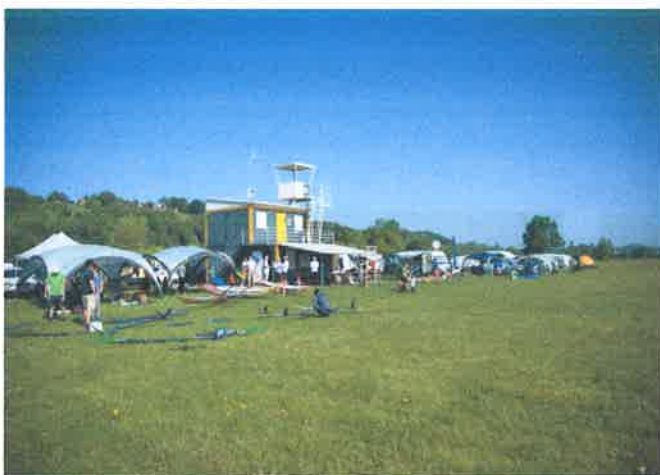
F5J Trešnjevka Cup 2018.

Natjecanje zrakoplovnih modelara u kategoriji radioupravljanih modela jedrilica za termičko jedrenje sa elektro pogonom maksimalnog raspona krila 4 metra. Natjecanje FAI World Cup serije u organizaciji Modelarskog kluba Zaprešić i Modelarskog aero kluba Trešnjevka održano je na aerodromu „Rudolfa Perešina“. Nastupili su natjecatelji iz Austrije, Mađarske, Slovenije i Hrvatske i aktualni juniorski i seniorski evropski prvaci.