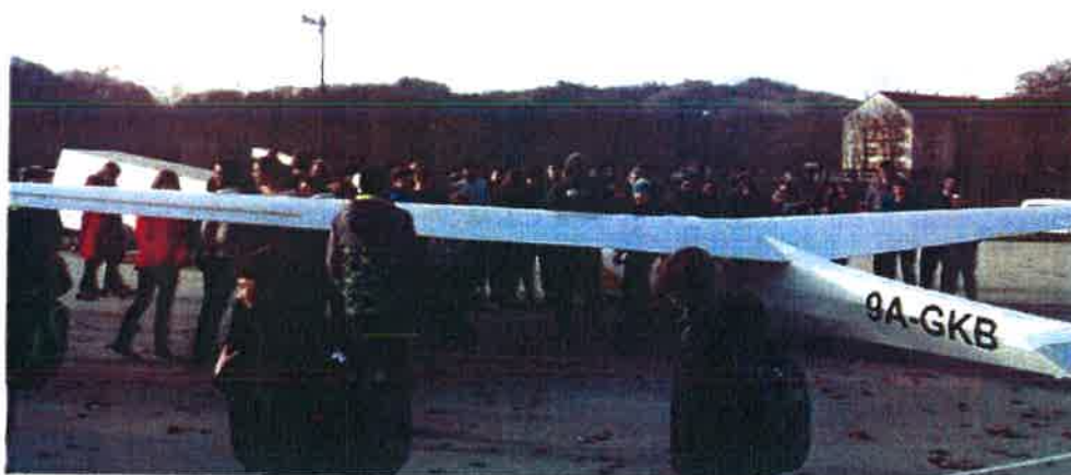
Učenici OŠ Krapinske T.i Pregrada u razgledavanju jedrilica u sklopu Zajednice tehničke kulture KZŽ

Predstavljanje Županijske zajednice tehničke kulture i Zagorskog aerokluba u Krapinskim Toplicama i Pregradi