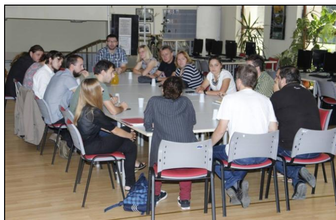
Sudionici Konferencije Županijskih savjeta mladih, Lepoglava

Tradicionalna neformalna okupljanja predstavnika Županijskih savjeta mladih u Lepoglavi tijekom kolovoza, 2014. godine po prvi su puta prerasla u formaliziranu i strukturiranu konferenciju Županijskih savjeta mladih. Dinamična struktura i periodične izmjene članova pojedinog Županijskog savjeta ukazale su na nužnost održavanja konferencija na kojima bi se pozitivna praksa iskusnijih članova Savjeta prenijela novim članovima, neovisno o županiji iz koje Savjet dolazi. Prilikom Konferencije u Lepoglavi uspoređeni su formati rada pojedinačnih