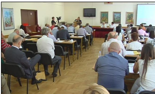
Sjednica skupštine Krapinsko – zagorske županije

Poštujući zakonom predviđenu proceduru, Županijski savjet mladih početkom 2014. godine podnio je izvješće o radu u proteklom razdoblju. Predstavljena je analiza uspješnosti realizacije usvojenog Programa rada za 2013. godinu i pojašnjena odstupanja od programa rada i korekcije istog. Predstavljajući izvješća iskorišteno je od strane vijećnika da izraze stav kluba zastupnika i svoj osobni stav glede ostvarenja predstavljenih od strane Županijskog savjeta mladih. Naglašena je važnost kvalitetnog izbora članova III. mandata Županijskog savjeta mladih krajem 2014. godine.