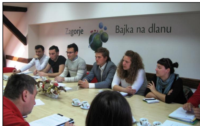
Jedanaesta sjednica Županijskog savjeta mladih

Jedanaesta sjednica Županijskog savjeta mladih bila je posvećena alternativnim oblicima ciljnog okupljanja mladih. Kao dio te skupine Savjet mladih prepoznao je okupljanje mladih oko vatrogasne zajednice, Crvenog križa te u odredima izviđača. Svaka organizacija treba s posebnom pozornošću prilaziti aktivnostima koje se odnose na rad s mladima. Iako se radi o javnim tijelima, položaj spomenutih organizacija nalikuje institucionalnom uređenju, što istima daje odgovorniju ulogu u zajednici. U tom slučaju uključivanje mladih u aktivnosti organizacije ne samo da ispunjava njihovo slobodno vrijeme već dugoročno priprema mlade za preuzimanje odgovornih uloga u društvu. Kumulativno time je stavljen dodatni naglasak na važnost odgovornog pristupa spomenutom segmentu mladeži. Kompetencije i vještine koje mladi stječu ovakvim angažmanom direktno su stavljene na uslugu društvu u dugom roku zbog čega je posebno važno osigurati dugoročno i stabilno funkcioniranje tih i sličnih organizacija. Savjet mladih ukazao je na potencijale integracije aktivnosti vatrogasnih društava, organizacija Crvenog križa te odreda izviđača, a koje su namijenjene mladima. Vjerujemo kako je nuđenjem sveobuhvatnih aktivnosti, u suradnji sa osnovnim i srednjim školama, mlade moguće dodatno motivirati na uključivanje u njihov rad, a širu javnost adekvatno informirati o njihovom značaju i ulozi.