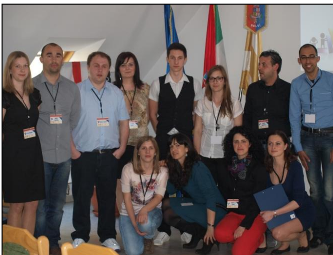
Sudionici otvaranja projekta Zlatarske udruge mladih

Zlatarska udruga mladih je u četvrtak 18. travnja održala otvorenje projekta Being young in EU - how to start na čijim su aktivnostima sudjelovali mladi sa područja grada Zlatara. Nakon uspješnog zadovoljavanja formalnih kriterija prihvatljivosti, te kriterija kvalitete, od strane Europske