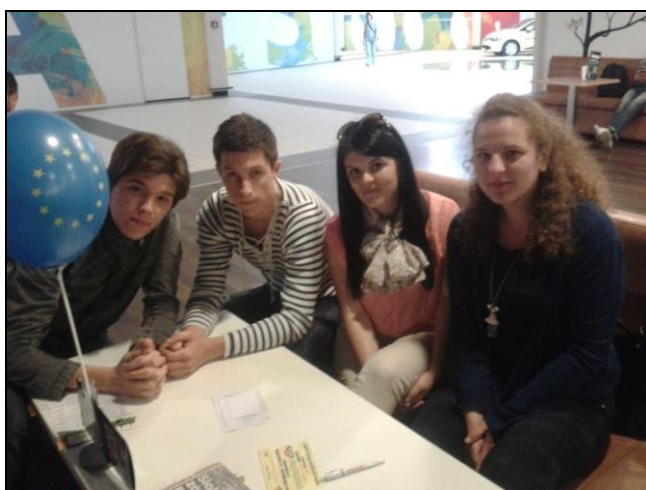
Predstavnici Županijskog savjeta mladih na Europskom tjednu

Varaždinska županija je u sklopu obilježavanja Europskog tjedna (6.-11. svibnja 2013.) bila domaćin EU Pub kviza na kojem je sudjelovala peteročlana ekipa ispred Krapinsko - zagorske županije. Savjet za europske integracije Varaždinske županije već trinaest godina obilježava Europski tjedan. Ovogodišnji Europski tjedan odvijao se od 6. svibnja pa do subote, 11. svibnja. Bogat program za građane bio je isplaniran tijekom cijelog tjedna. Građani su tako imali prilike sudjelovati na programima poput „Hrvatski građani-europski građani - Europsko građanstvo i potrošačka prava“ koji je održan na Franjevačkom trgu, središnjoj manifestaciji obilježavanja Europskog tjedna „Okusi Hrvatske“ koja je bila ujedno i manifestacija obilježavanja ulaska Republike Hrvatske u Europsku uniju, manifestaciji „Europa u srcu Varaždinske županije-Hrvatska razglednica putuje Europom“, te mnogim drugim manifestacijama i programima. Uz spomenute manifestacije i programe održao se u Lumini centru European Ultimate Pub quiz, na kojem su sudjelovale ekipe iz Međimurske,