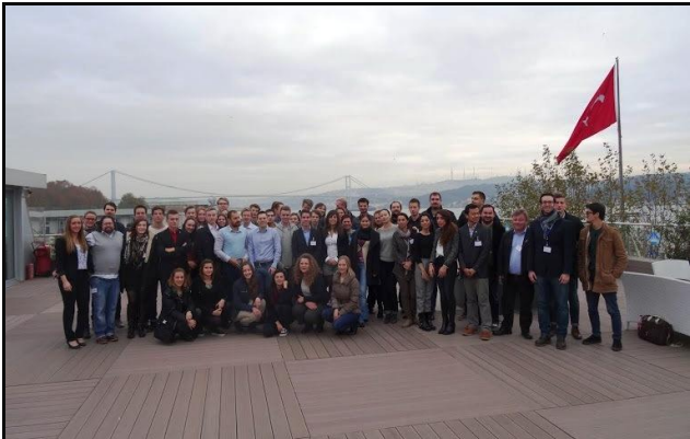
Sudionici plenarnog zasjedanja YRN-a u