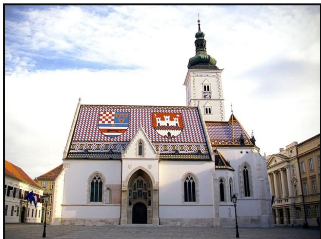
Crkva Sv. Marka, Zagreb