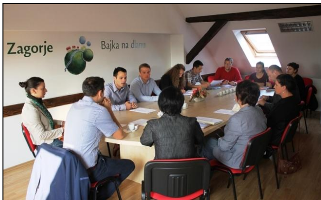
Trinaesta sjednica Županijskog savjeta mladih

Četiri godine nakon konstituirajuće sjednice 1. saziva Županijskog savjeta mladih, aktualni je saziv Savjeta 13. sjednicu održao pod temom Županijski savjet mladih 3.0. Na sjednici su uz analizu dosadašnjeg rada Savjeta utvrđene prednosti i slabosti postojećeg koncepta te definirana očekivanja od sljedećeg saziva Savjeta i njegovih članova. Savjetodavno tijelo sastavljeno isključivo od mladih osoba zakonski je obavezna osnovati svaka jedinica lokalne i regionalne samouprave. I dok je Krapinsko – zagorska