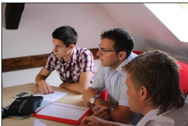
Dvanaesta sjednica Županijskog savjeta mladih