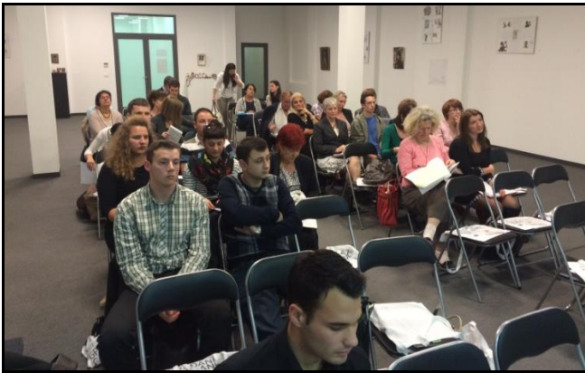
Konferencija o potencijalima razvoja Društvenog poduzetništva