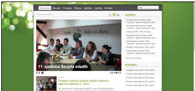
Nova web stranica Županijskog savjeta mladih

Kako bi se maksimalno povećala transparentnost te javnosti jasno prezentirali rezultati rada Županijskog savjeta mladih, tijekom ožujka je osmišljena, dizajnirana i pokrenuta nova web stranica Savjeta. Na web stranici su uz skraćena izvješća, za svaku sjednicu dostupni svi radni dokumenti: poziv, zaključak i potpuni zapisnik. Time je dodatno otvoren rad Savjeta zainteresiranoj javnosti. Uz informacije o sjednicama, web stranica pruža i novosti o ostalim aktivnostima Savjeta, ponajviše međunarodnoj suradnji te detaljne informacije o svakom članu Savjeta. Administriranje web stranice Županijskog savjeta mladih time je sa Mreže udruga Zagor prenesena na stručne službe Županije čime je povećana dinamika osvježivanja informacija te povećana pouzdanost i stabilnost web servisa.