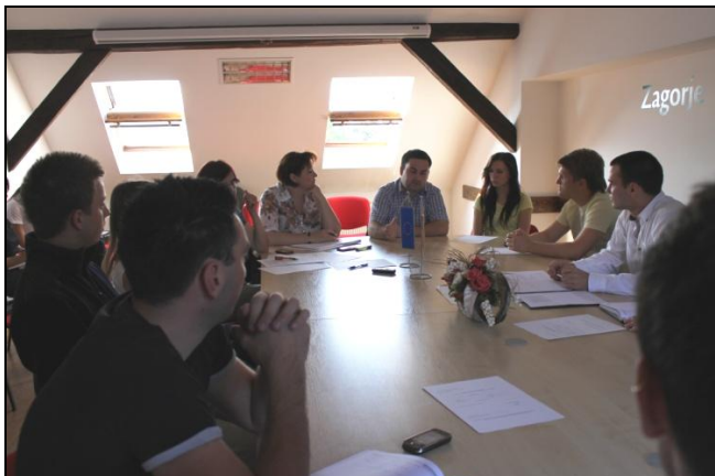
Peta sjednica Županijskog savjeta mladih