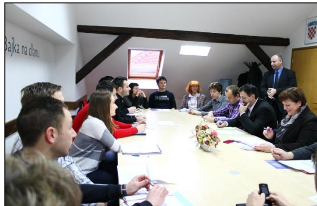
Deveta sjednica Županijskog savjeta mladih