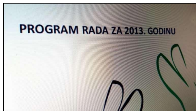
Program rada Županijskog savjeta mladih

Na sjednici održanoj 22. veljače, Savjet mladih usvojio je Program rada za 2013. godinu. Do kraja godine rad Savjeta usmjeren je u tri tematska poglavlja, a sjednice su planirane jednom u dva mjeseca. Programom rada Savjeta mladih propisuju se i određuju temeljna načela djelovanja i temeljne smjernice budućeg rada te se utvrđuju programske i druge aktivnosti potrebne za njihovo ostvarenje. Program rada Savjeta mladih sastoji se od 3 poglavlja: (1) Aktivno sudjelovanje mladih u društvu i civilno društvo; (2) Mobilnost, informiranje i savjetovanje te (3) Kultura mladih, sport i slobodno vrijeme. Radi pronalaženja najboljih mogućih rješenja za probleme mladih u Krapinsko-zagorskoj županiji, Savjet mladih će u okviru predloženih poglavlja: (1) organizirati okrugle stolove i tematske sjednice; (2) služiti će se javnim zagovaranjem i javnim kampanjama pri poticanju rasprave; (3) razmjenjivati iskustava s drugim Savjetima mladih u županiji i Hrvatskoj; (4) razmjenjivati iskustva sa jedinicama lokalne i regionalne samouprave u Hrvatskoj; (5) sudjelovati u radu nadnacionalnih i regionalnih platformi, a posebice u okviru Youth Regional Network-a (YRN); (6) sudjelovati na