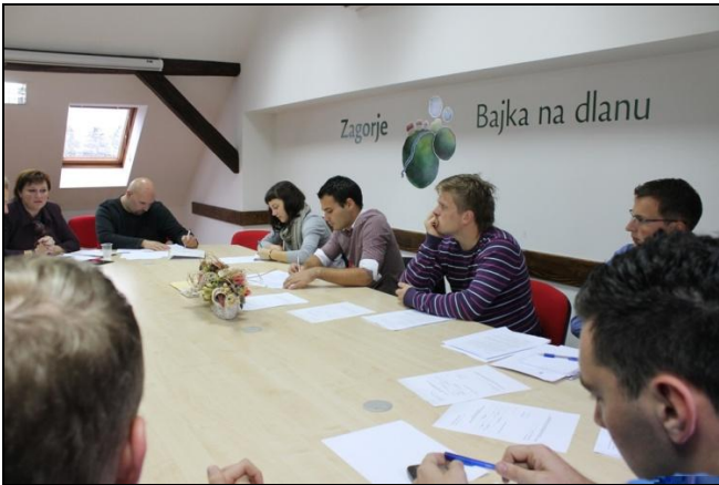
Šesta sjednica Županijskog savjeta mladih