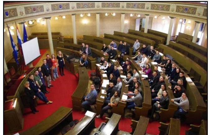
Predstavnici savjeta mladih na Nacionalnoj konferenciji

Predstavnici Savjeta mladih Krapinsko - zagorske županije sudjelovali su na ovogodišnjoj, šestoj po redu, Nacionalnoj konferenciji Savjeta mladih. Konferencija je održana na temu Centara za mlade koji kroničnu nedostaju ne samo Zagrebu, već i drugim gradovima u Republici Hrvatskoj. Centri za mlade su mjestima gdje se mladi mogu družiti, educirati, informirati, aktivno uključivati u osmišljavanje i realizaciju projekata. Na Konferenciji je sudjelovalo oko 60 mladih iz županijskih, gradskih i općinskih Savjeta mladih diljem Hrvatske, a uz domaće sudjelovali su i govornici iz Velike Britanije. Osim gostiju iz inozemstva, radne skupine vodili su i predstavnici Gradskih ureda Grada Zagreba. Na konferenciji su gostovali i mladi iz Centra za mlade Lepoglava, kao i youth workeri iz Centra za mlade Ljubljana. Ova Konferencija je napravljena u suradnji s Velikom Britanijom, tako da je otvorenju nazočila i zamjenica veleposlanika. Savjeti mladih na dosadašnjim konferencijama imali su prilike baviti se tematikama zapošljavanja mladih, stambenog zbrinjavanja, obrazovanja, okvirima djelovanja Savjeta i samim Zakonima koji ih se tiču. Koliko je zapravo važno i ohrabrujuće saznati kako još uvijek postoji skupina mladih ljudi koji ne gledaju na politiku samo pasivno, već u njoj sudjeluju i aktivno, naglasio je sam predsjednik Gradske skupštine.