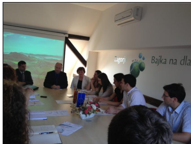
Četvrta sjednica Županijskog savjeta mladih

Uoči biciklističke sezone Savjet mladih raspravljao je o sigurnosti biciklističke infrastrukture, sadržaju koji se mladima nudi te programima usmjerenim na popularizaciju biciklizma. Okrugli stol održan je na temu "Popularizacija biciklizma - potencijal i mogućnosti unaprjeđenja biciklističke kulture i prometne infrastrukture u Krapinsko – zagorskoj županiji". Cilj okruglog stola je okupiti sve relevantne dionike šireg raspona disciplina i struka s područja odgoja i obrazovanja, uprave te razvoja prometne infrastrukture i turizma, kako bi se potaknula i pokrenula rasprava o razvoju biciklističke kulture i mogućnostima uvođenja biciklističkih ruta i staza. Na okruglom stolu sudjelovali su predstavnici Zagorske razvojne agencije, Saveza biciklista, Turističke zajednice KZŽ, Krapinsko – zagorske županije Policijske uprave KZŽ te Županijske uprave za ceste. Savjet mladih zaključio je kako je potrebno raditi na edukaciji i senzibiliziranju stanovništva i motiviranju kreatora turističke ponude u cilju iskorištavanja potencijala. Prije same tematske rasprave članove Savjeta mladih pozdravili su novi župan Krapinsko-zagorske županije Željko Kolar i njegovi zamjenici mr.sc. Jasna Petek prof. te Anđelko Ferek-Jambreč, dipl.ing. Župan i zamjenici podsjetili u članove Savjeta mladih kako su uvijek otvoreni za sugestije i prijedloge.