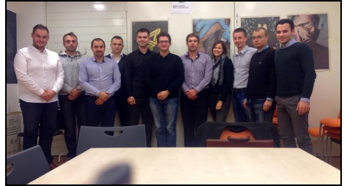
Predstavnici županijskih savjeta mladih