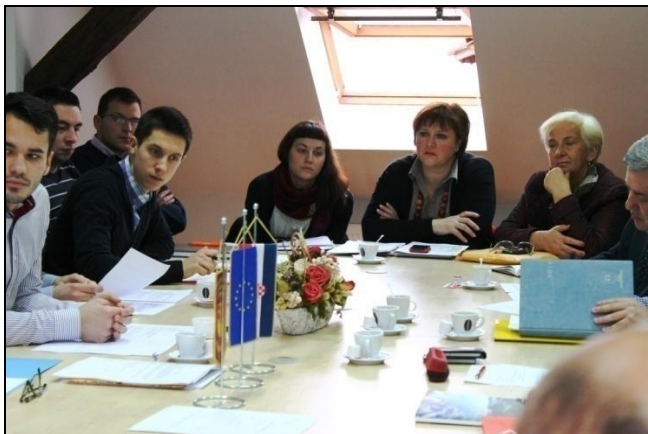
Deseta sjednica Županijskog savjeta mladih