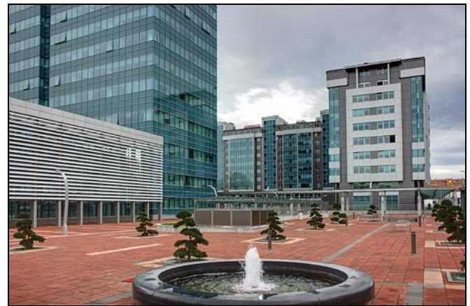
Sjedište Vlade Republike Srpske, Banja Luka

Predsjedništvo Regionalne mreže mladih (YRN) redovito održava sjednice između uobičajenih plenarnih sjednica Mreže. Svaka sjednica omogućava kontinuitet rada Mreže, adresiranje tekućih pitanja, unaprijeđenje rada i razvoj strategija te otvara poseban prostor za uspostavljanje suradnje sa novim regijama. Jesenska sjednica 2013. godine je na poziv Republike Srpske održana u Banja Luci. Upravo je aspiracija prema regionalnoj i međunarodnoj suradnji i razmjeni iskustava potaknula Republički savjet mladih Republike Srpske da ugosti Predsjedništvo Regionalne mreže mladih. Tijekom susreta predstavnika YRN-a i Republičkog savjeta mladih zaključeno je kako bi suradnjom sa Savjetima mladih i sličnim regionalnim organizacijama koje imaju dužu tradiciju postojanja i više iskustva Republički savjet mladih mogao unaprijediti svoj rad i konstruktivnije djelovati. Zaključeno je kako YRN može pružiti instrumente za poticanje regionalne i međunarodne suradnje te pomoći buduće međuregionalne projekte ponajprije angažiranjem svojih članica, ali i pružanjem tehničke potpore suradnji i projektima. Sama sjednica Predsjedništva bila je posvećena izradi nacrtu ključnih