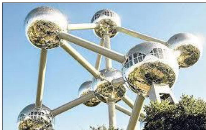
Atomium, znamenitost Bruxellesa

Predsjednik Savjeta mladih sudjelovao na sjednici Predsjedništva Regionalne mreže mladih