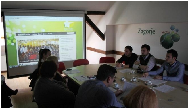
Petnaesta sjednica Županijskog savjeta mladih