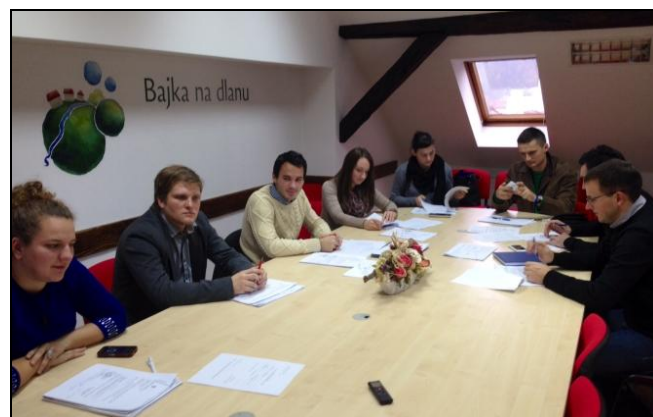
Sedma sjednica Županijskog savjeta mladih

Usvajanjem programa rada za 2014. godinu Savjet mladih nastavio je sa kontinuiranom raspravom o specifičnim problematikama mladih. Za 2014. godinu predviđeno je 7 tematskih sjednica s najvećim naglaskom na socijalnu i ekonomsku uključenost mladih u društvo. Sedma sjednica Savjeta mladih najvećim je dijelom posvećena identifikaciji aktualnijih problematika s kojima se mladi susreću. Tijekom 2014. godine Županijski savjet mladih odlučio je zadržati već implementiran koncept rada temeljen na tematskim sjednicama. Pokazalo se kako otvorenom raspravom sa stručnim i iskusnim osobama, Županijski savjet mladih može uočiti uzroke određenih problema. Tradicionalni pristupi rješenjima ostavljaju se u drugom planu jer dugoročne probleme ne možemo riješiti primjenom onih razmišljanja koja su nas dovela do tih problema. Županijski je savjet