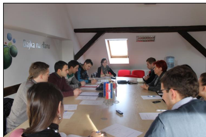
Treća sjednica Županijskog savjeta mladih

Razmatrana problematika „Sudjelovanje mladih u demokratskom procesu“