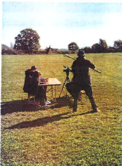
Snimanje HRT-ove emisije LUKA I PRIJATELJI

Luka i prijatelji – snimanje HRT-ove emisije dana 1. listopada 2018. godine na aerodromu „Rudolfa Perešina“ u suradnji s OŠ KSAVER ŠANDOR GJALSKI iz Zaboka na temu letenja.