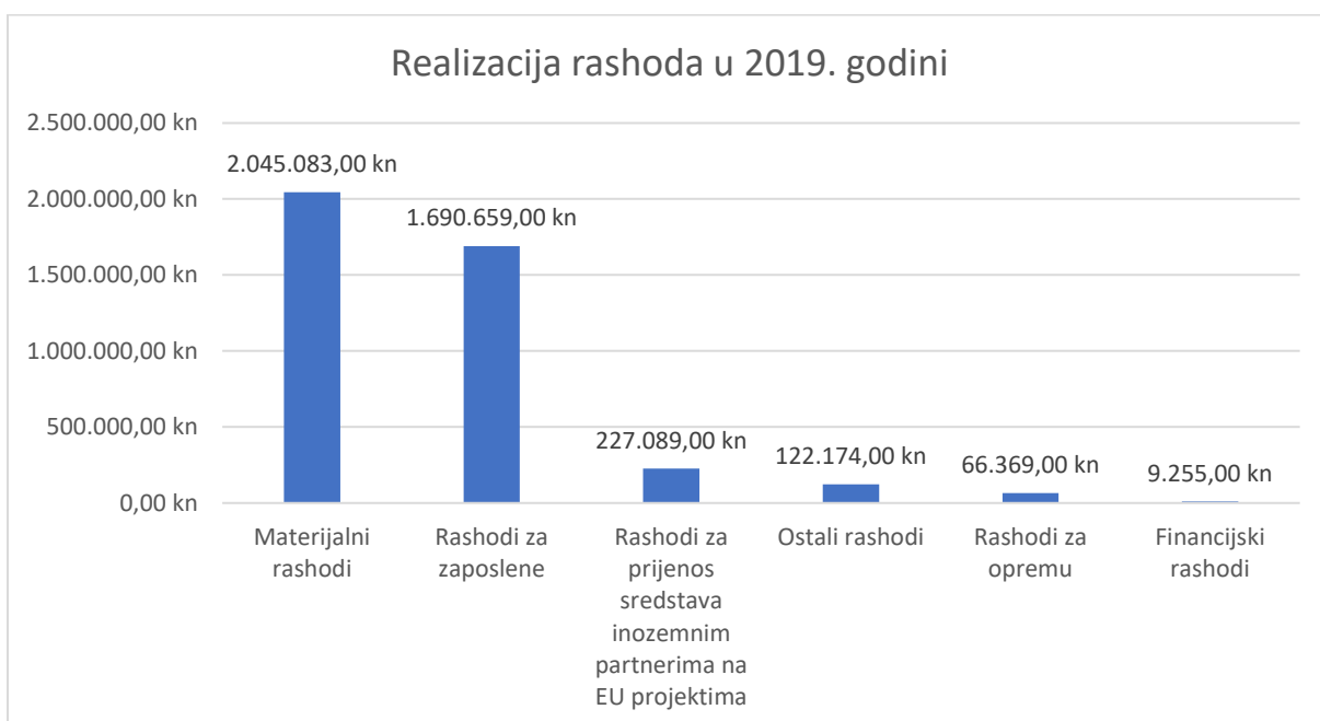
Grafikon 2: Realizacija rashoda Zagorske razvojne agencije u 2019. godini

U strukturi rashoda glavina troškova odnosi se na materijalne troškove nužne za provedbu projektnih aktivnosti te za operativan rad agencije. Troškovi rada djelatnika čine 40% ukupnih rashoda Agencije, budući da srž poslovanja Agencije čini pružanje savjetodavnih usluga tijelima javne vlasti s područja Krapinsko-zagorske županije te materijalni rashodi koji u sebi sadrže sve troškove vanjskih usluga provedbe projekata.