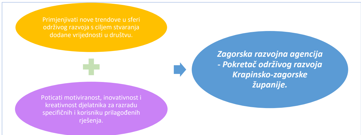
Grafikon 1 - Vizija i misija Zagorske razvojne agencije

Izvešće o radu strukturirano je tako da prikazuje aktivnosti prema ciljevima rada, a uz opis aktivnosti, Izvešće o radu Zagorske razvojne agencije za 2019. godinu daje i pregled financijskog poslovanja uz navođenje izvora financiranja.