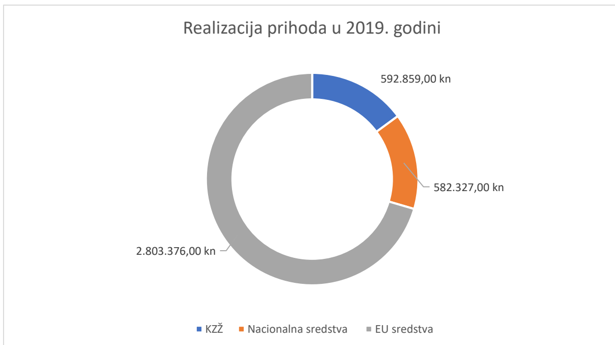
Grafikon 1: Realizacija prihoda Zagorske razvojne agencije u 2019. godini