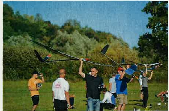
F5J Cup 2020.