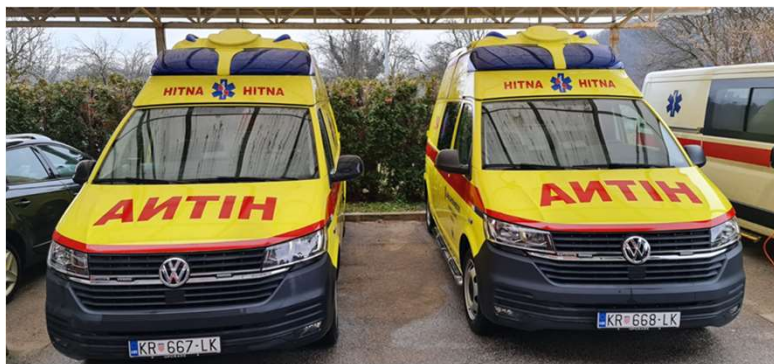
Nova vozila HMS za Ispostave u Pregradi i Klanjcu