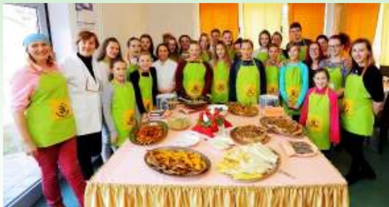
“Uloga županija u stvaranju zajednica prijatelja djece”, Zabok, 7. prosinca 2016.