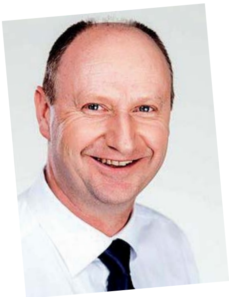
Željko Kolar, župan Krapinsko-zagorske županije

Nadomak vrevi glavnog grada, u sjeverozapadnom dijelu Hrvatske čeka vas Zagorje – bajka na dlanu. Oaza je to čudesne prirode, zelenila i zdravlju ljekovitih voda. Područje je to najveće koncentracije spomeničke, arhitektonske i kulturne baštine u ovom dijelu Europe. Veliko prometno značenje Krapinsko-zagorske županije daje međunarodna trasa autoceste koja prolazi duž cijele Županije i predstavlja sastavni dio sjeverozapadnog ulaza/izlaza Republike Hrvatske prema Europi. Zbog toga je prioritetni cilj Županije gospodarski razvoj istodobno ne ugrožavajući prirodne ljepote i znamenitosti našeg kraja. Obnovljivi izvori energije i učinkovito korištenje energije prepoznati su kao nerazdvojna cjelina koja može i treba značajno doprinijeti održivom razvoju Županije. Krapinsko-zagorska županija prva je u Republici Hrvatskoj izradila vlastitu Strategiju održivog korištenja energije .