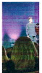
AKTIVIZAM / 2 tj