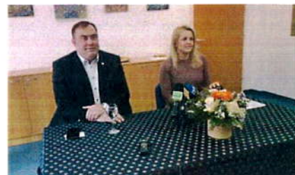
INSTITUCIJE / 4 dana ago