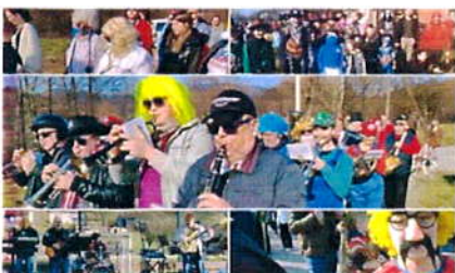
NAJAVE I DOGAĐANJA / 1 tjedan ago