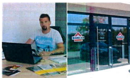
PODUZetništvo / 2 tjedna ago