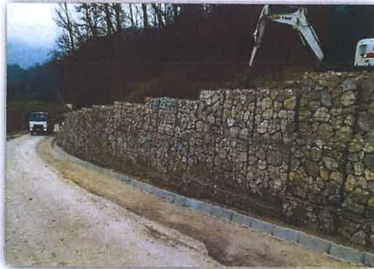
2.1.1.7. Sanacija klizišta Dugnjevec na L22029