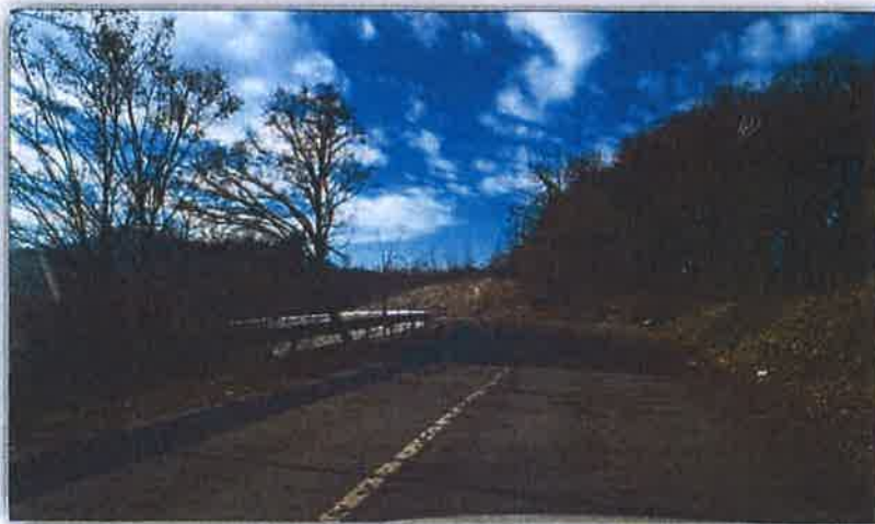
2.1.1.4. Sanacija klizišta Vinski Vrh na Ž2204