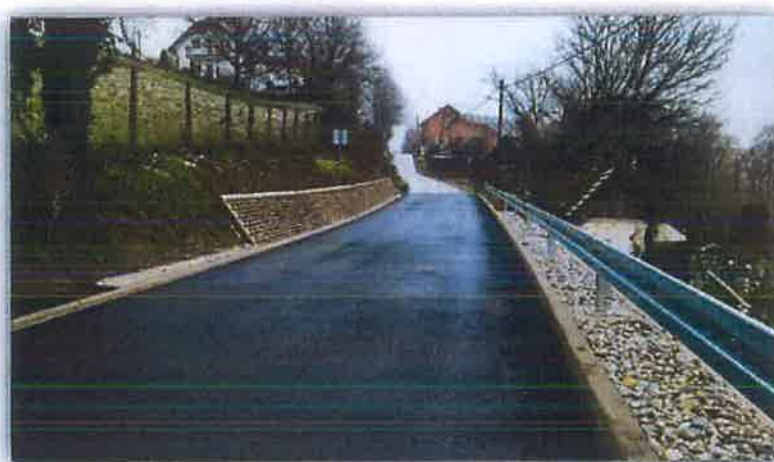
2.1.1.6. Sanacija klizišta Donji Škrnik na L22027