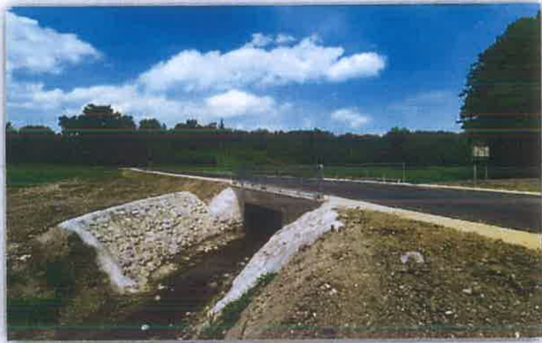
2.3.1.3. Sanacija propusta Zlatar na L22052