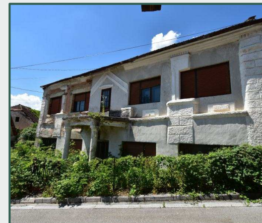
Kupnja rodne kuće Antuna Augustinčića