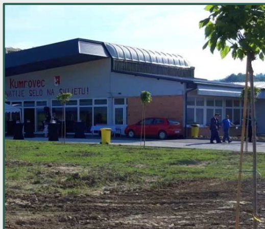
Uređenje Društveno- kulturalnog doma u Razvoru