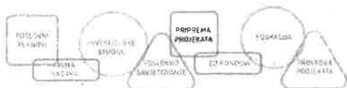
Vlatka Mlakar, Pročelnica Upravnog odjela za javnu nabavu i EU fondove

Društvo je upisano u sudski registar Trgovačkog suda u Zagrebu pod brojem MBS 080202268 | OIB 63625874835 | SWIFT (BIC) PBZGHR2X | IBAN HR61234000 91100211834 | Porezni broj 01353519 | Temeljni kapital društva iznosi 358.900,00 kuna 47.634,22 eura (fiksni tečaj konverzije 1€ = 7,53450 kn) i uplaćen je u cijelosti | Upravu društva čini direktorica Helena Matuša